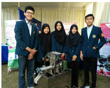
Tim PUTION MAC